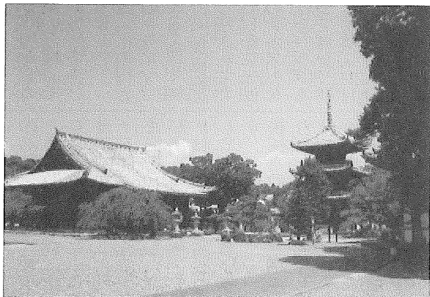
写真「道成寺の塔」 大木弘子(大開1丁目)