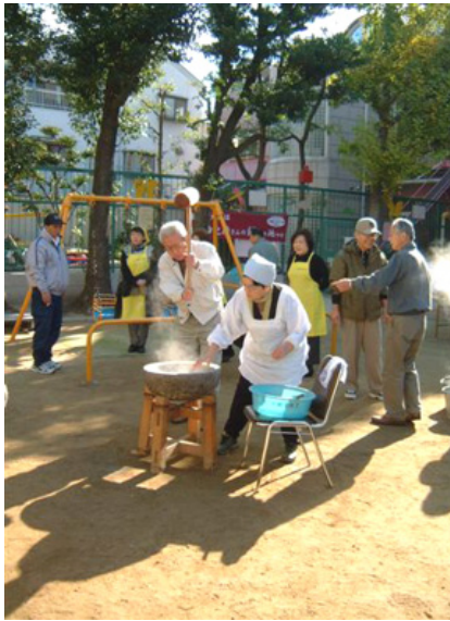
昨年の「ぜんざいパーティ」大開公園にて

部会の活動につきましては、第一回「野田藤まつり」開催に向けて藤の苗木を里子に出し、大きな鉢へ植替える相談会も実施しました。また、大開公園で昨年十一月二十日に行われた記念碑建立記念「ゼ