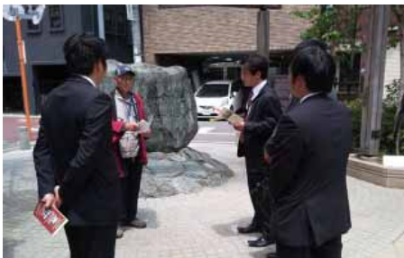
熱心に耳を傾ける塾生