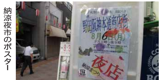
納涼夜市のポスター

今年には本校生徒4人がパナソニック電工で研修を受講し、ものづくりの腕を磨いております。また、1名が正社員として就職し新製品の工程管理部門で頑張っております。